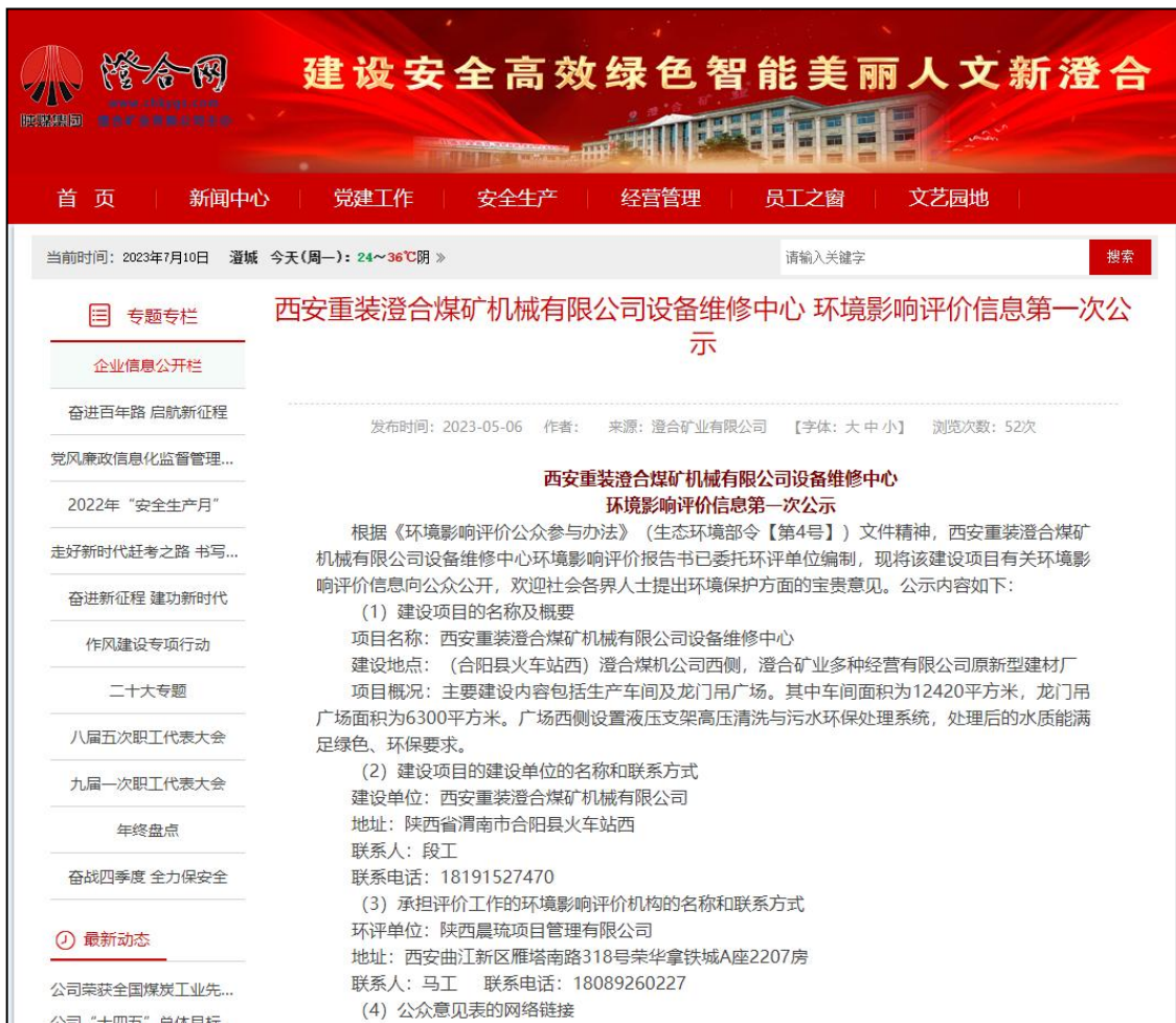
图1 第一阶段网络平台公示截图（部分）

http://www.chkys.com/html/ztbd/zxzt/qyxxgkl/202305/45199.html?VbjyC7VAwf3i=1683364445881 ，部分截图见图1。