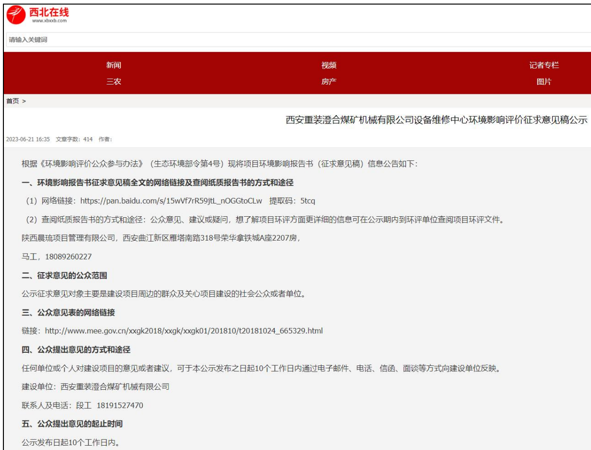
图 2 第二阶段征求意见稿网络平台公示截图（部分）

征求意见稿的网络公示采取在当地多媒体网《西北在线》上公示的方式，公示时间为 2023 年 6 月 21 日，网址为 http://m.xbxxb.com/pcarticle/726562 ，部分截图见图 2。