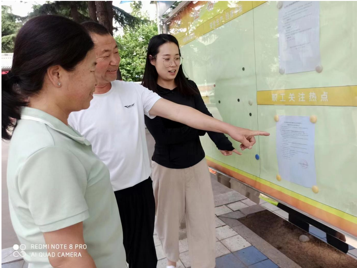
图 5 第二阶段征求意见稿现场张贴公示图

在西安重装澄合煤矿机械有限公司厂区公示张贴了公告，公示方式选取符合《环境影响评价公众参与办法》中相关要求，公示照片见图 5。