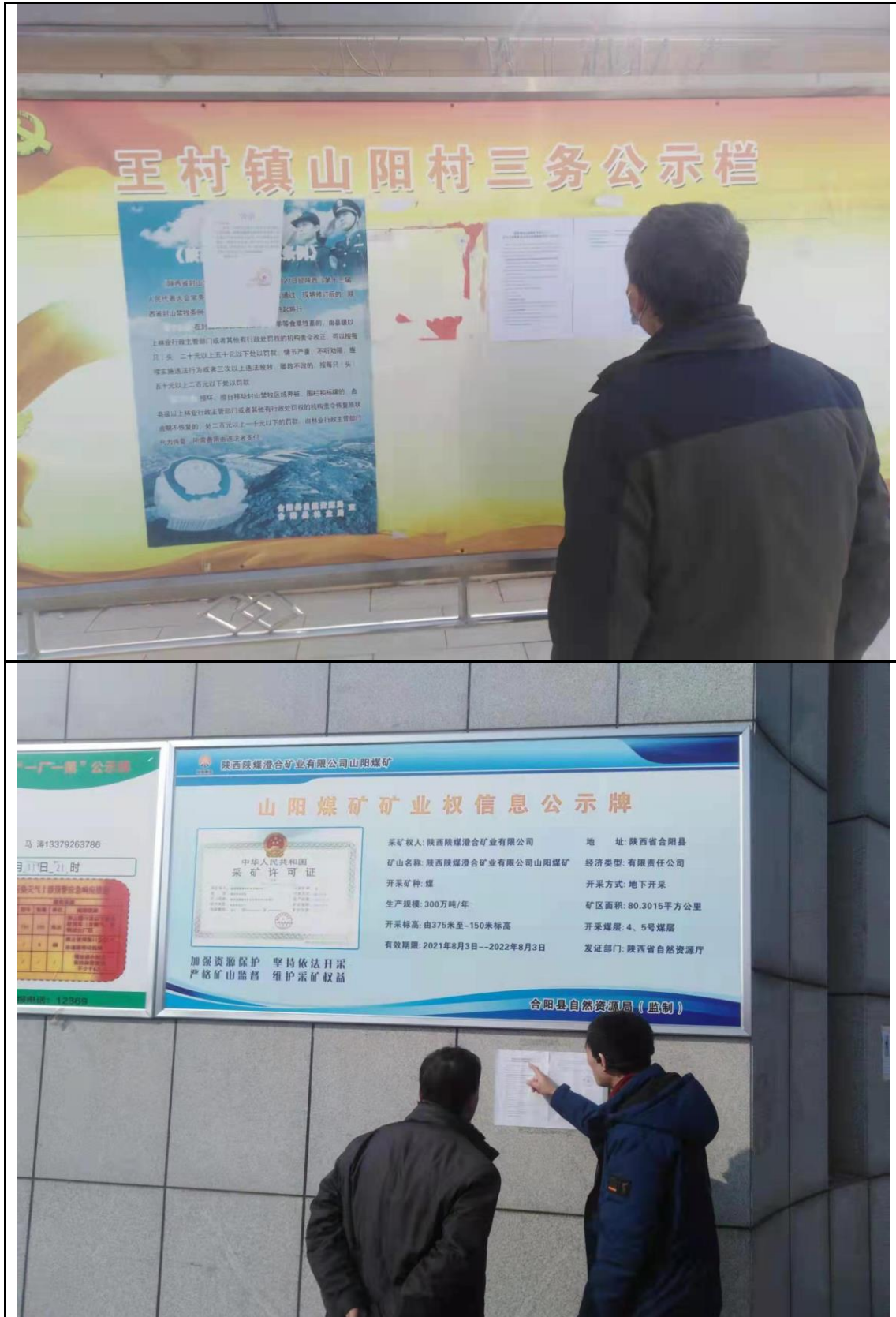
图 4 环境影响评价信息二次公示 (张贴)