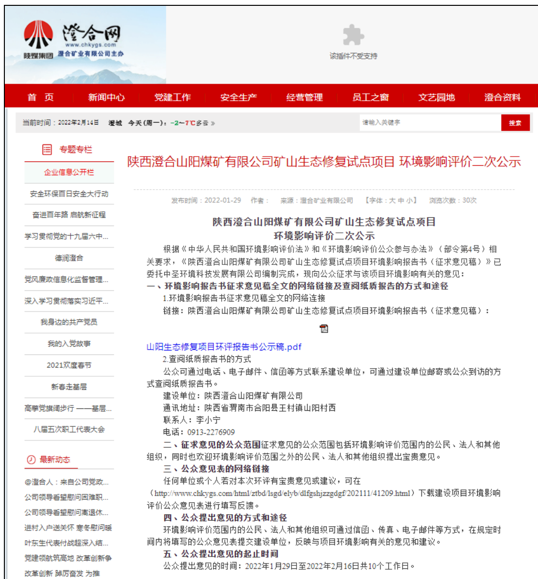
图 2 环境影响评价信息二次公示（网站）