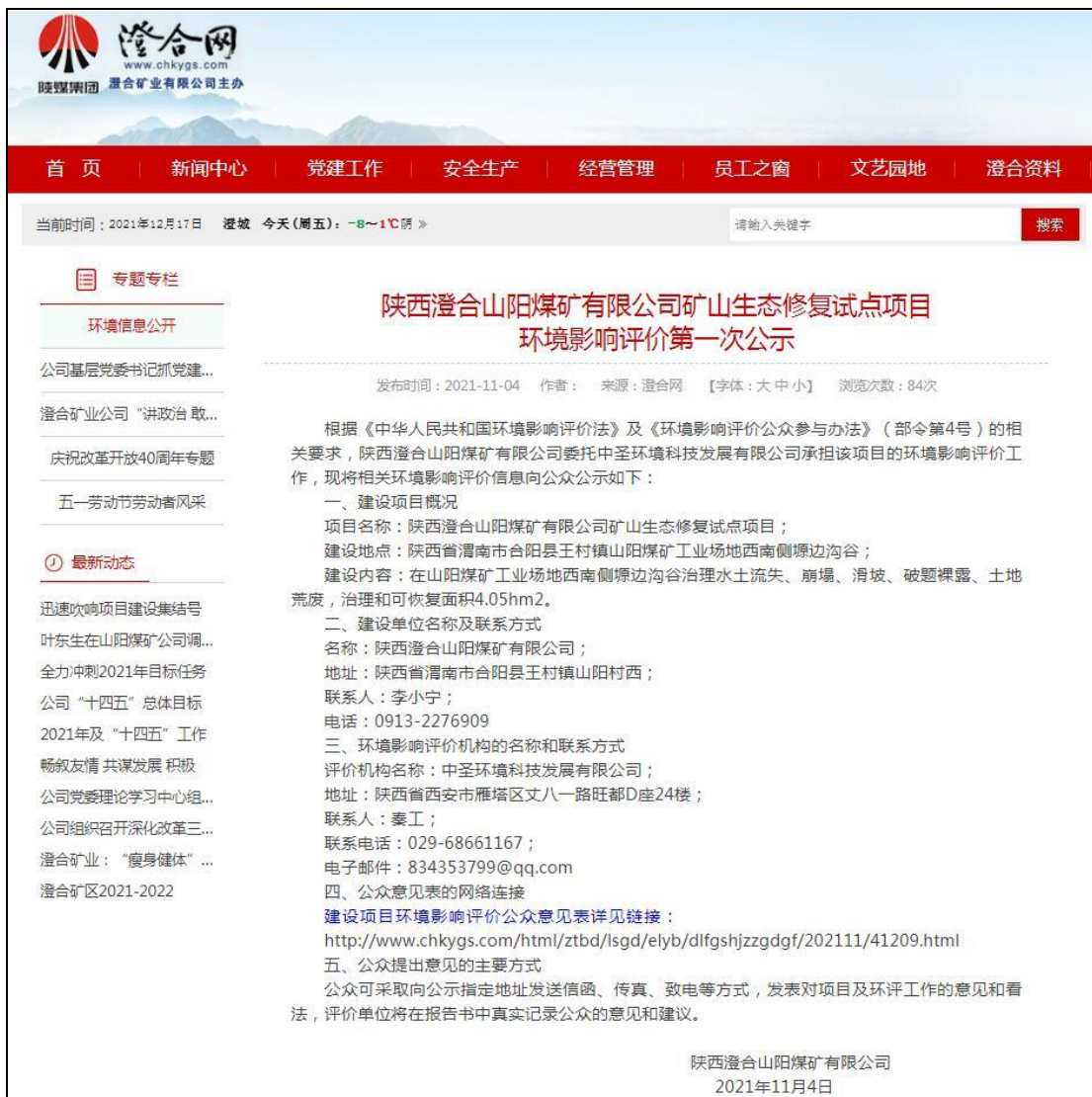
图 1 环境影响评价信息首次公示 (网站)